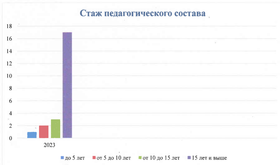
Диаграмма общего стажа педагогического состава Детского сада:

В 2023 году приняли на работу студентку, обучающуюся по образовательной программе высшего профессионального образования по направлению «Дошкольное образование» на должность воспитатель. Это позволило «закрыть» одну из имеющихся вакантных должностей в штатном расписании, перераспределить нагрузку педагогов и понизить средний возраст работников.